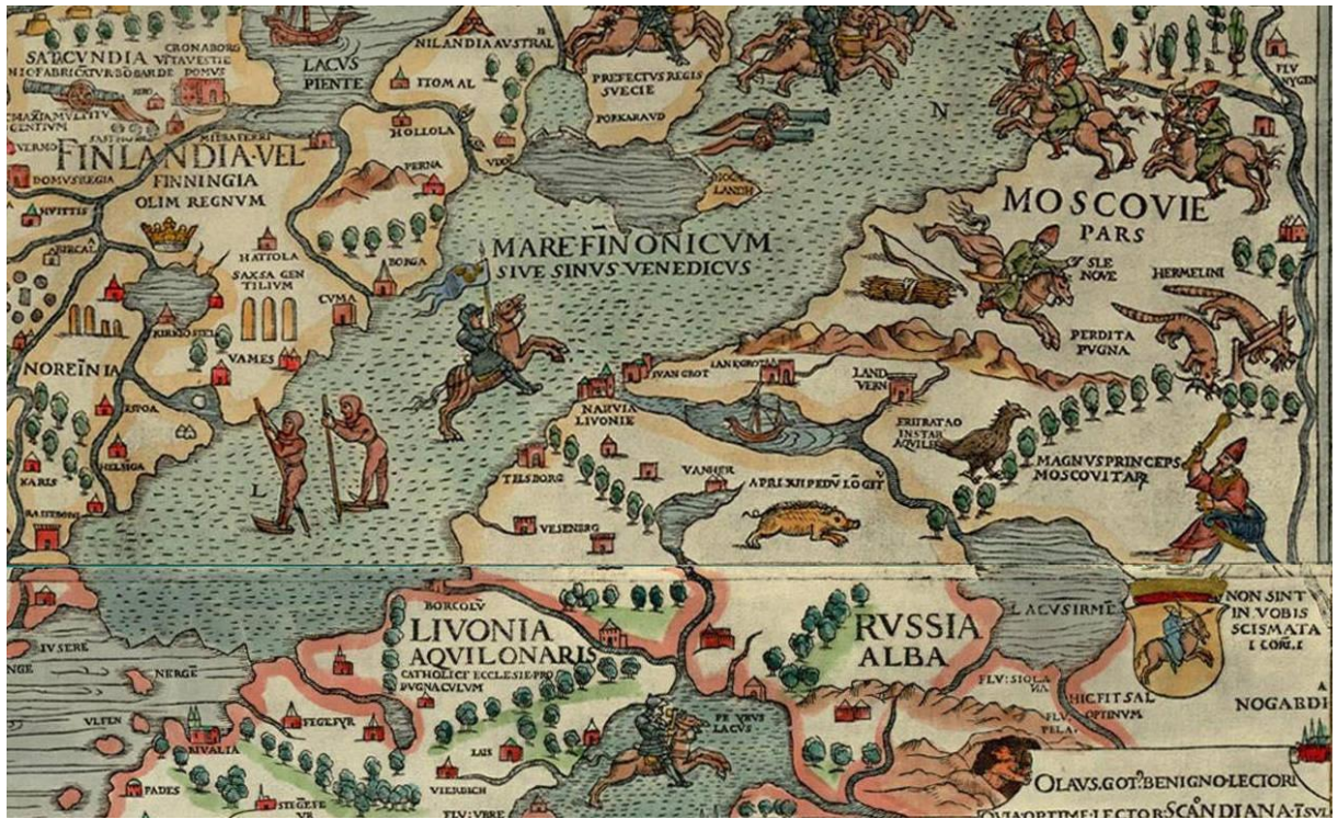
Рис. 5. Карта 1459 года

В 1796 году образована Белорусская губерния с центром в Витебске. В её состав вошло 16 уездов Полоцкого и Могилёвского наместничеств Российской империи: Белицкий, Велижский, Витебский, Городокский, Динабургский, Люцинский, Могилёвский, Мстиславский, Невельский, Оршанский, Полоцкий, Рогачёвский, Себежский, Сенненский, Чаусский и Чериковский. В 1802 году она делится на две губернии и преобразуется в Белорусское генерал-губернаторство 77 .