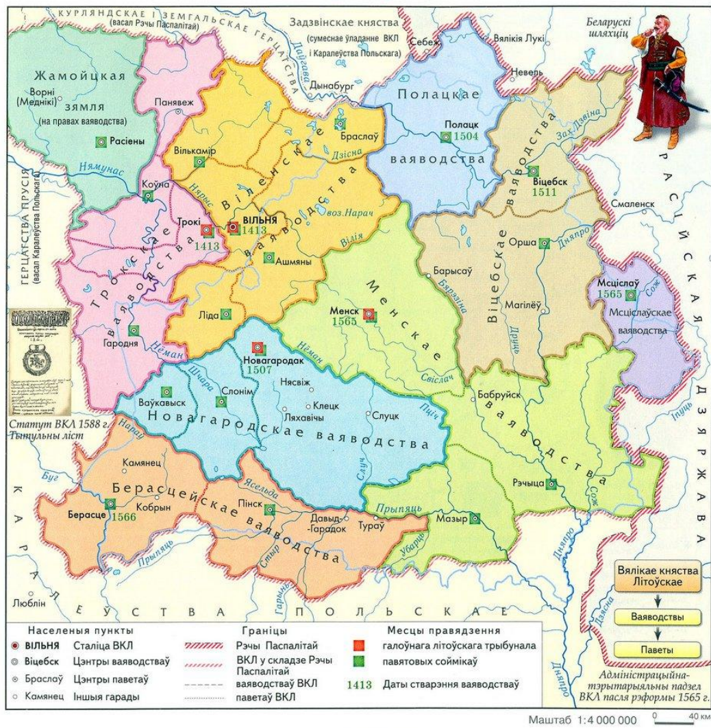
Рис. 4. Великое княжество Литовского в XVI веке

Интересно, что эту карту явно рисовали современные белорусы, выдавая её за свою историческую прародину, при этом нигде на ней нет ни малейшего указания на присутствие самих белорусов, кроме нарисованного в верхнем правом углу белорусского шляхтича . «Но вся заковыка в том, что никакой «белорусской» шляхты ни в XVIII, ни в XIX веках на территории современной Беларуси не было. По своей национально-культурной идентификации это были поляки, которые ментально были абсолютно чужды коренному населению, т. е. белорусам. Сами сенаторы Речи Посполитой, когда речь шла об этнической принадлежности коренного жителя Белой