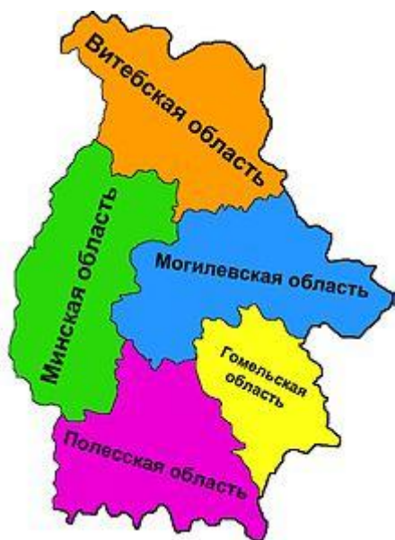
Рис. 6. Белорусская ССР на 1 сентября 1939 г.

После заключения Пакта Молотова-Риббентропа (28 сентября 1939 года в Москве подписан договор между СССР и Германией о дружбе и границах) Германия и СССР в сентябре 1939 года разделили Польшу, 18 сентября 1939 года Красная Армия заняла политический и культурный центр Западной Белоруссии г. Вильно, который вошёл в состав Советской Белоруссии, а законом СССР от 2 ноября 1939 года к БССР была присоединена Западная Белоруссия, включавшая в себя и