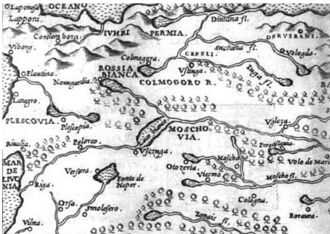
Рис. 3. Фрагмент карты из книги «La Geografia» итальянского картографа Дж. Рушелли (1561 г.)

Позже так стали называться земли московских правителей. В Речи Посполитой название Белая Русь с конца XVI века употреблялось по отношению к части современной территории Белоруссии, а именно к Полоцкой земле. Итальянский картограф Дж. Рушелли 31 на своей карте из книги «La Geografia» (1561 г.) поместил Белую Русь (Rossia Bianca) в район Новгорода и Холмогор 32 (рис. 3).