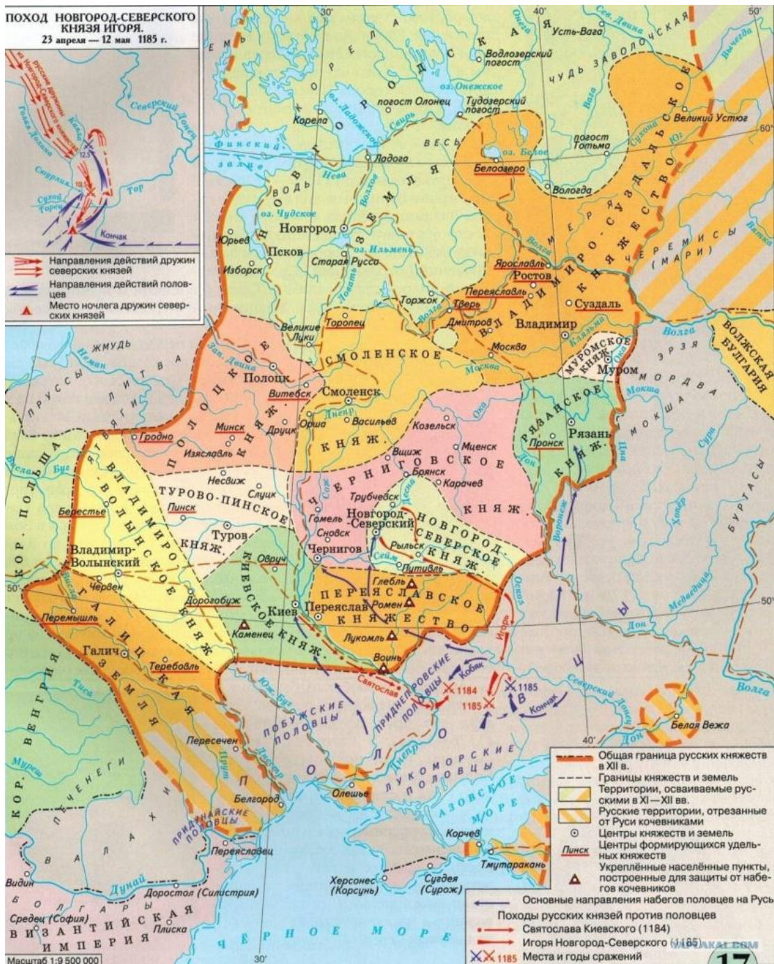
Рис. 1. Европа в XII веке

Белорусский историк Вацлав Ластовский считает, что кроме кривичей так называемые «белорусские земли» населяли древляне, радимичи, вятичи и дреговичи, отмечая, что все они представляли собой «просто ветви единого кривского племени», что на последних оказывалось литовское, польское,