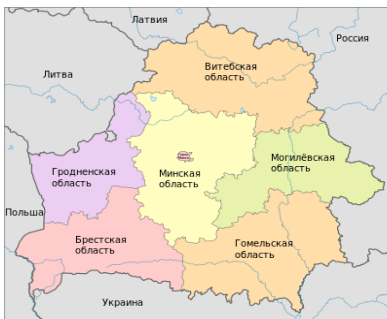
Рис. 7. Административное деление Беларуси

В июле 1994 года состоялись выборы Президента. В результате всенародного голосования первым, и пока единственным, Президентом Республики Беларусь избран Александр Григорьевич Лукашенко (род. 1954 г.). Территориальное деление современной Беларуси представлено на рис. 7.