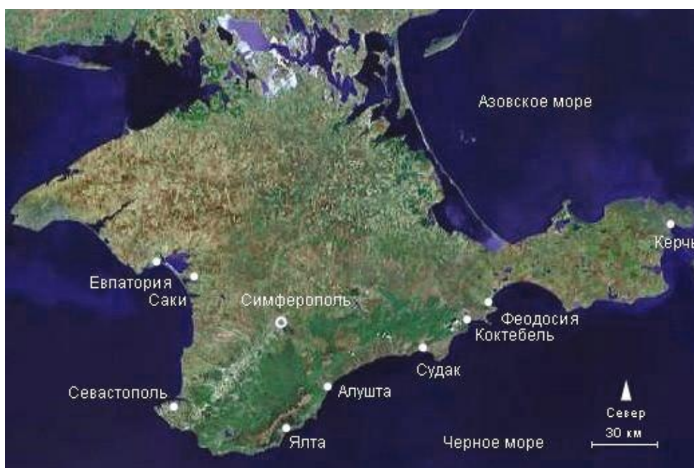
Рис. 8. Карта основных городов современного Крыма

Карта основных городов современного Крыма приведена на рис. 8.