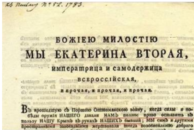
Рис. 6. Фрагмент указа Екатерины II о присоединении Крыма

Под руководством Потемкина пыльные татарские местечки с узкими кривыми улочками начинают перестраиваться в города с европейской планировкой: так возникают Евпатория, Симферополь и Феодосия, начинается строительство красоты и гордости русского мореходства – порта Севастополя. ...знать крымских татар, чья, присягнув Екатерине, сохранила за собой земельные владения и статус наследственной аристократии. Не