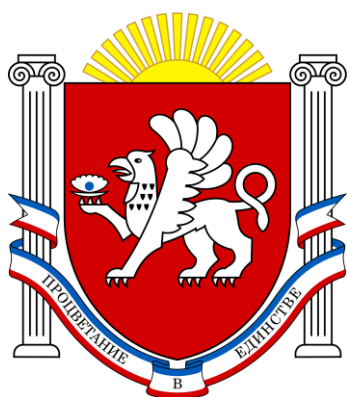
Рис. 9. Герб Крыма

Затем в этом же году произошло присоединение Крыма к Российской Федерации с образованием в составе последней новых субъектов федерации