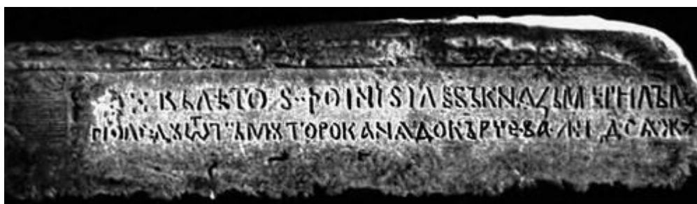
Рис. 4. Надпись на Тмутараканском камне

Далее, надпись на древнерусском языке на найденном в 1792 году Тмутараканском камне (Рис. 4) гласит: «В лето 6576-е (1068-й год по нашему летосчислению) Глеб князь (внук Ярослава Мудрого 86 ) мерил море по льду от Тмутороканя до Корчева. Насчитал 14 000 сажень» 87 .