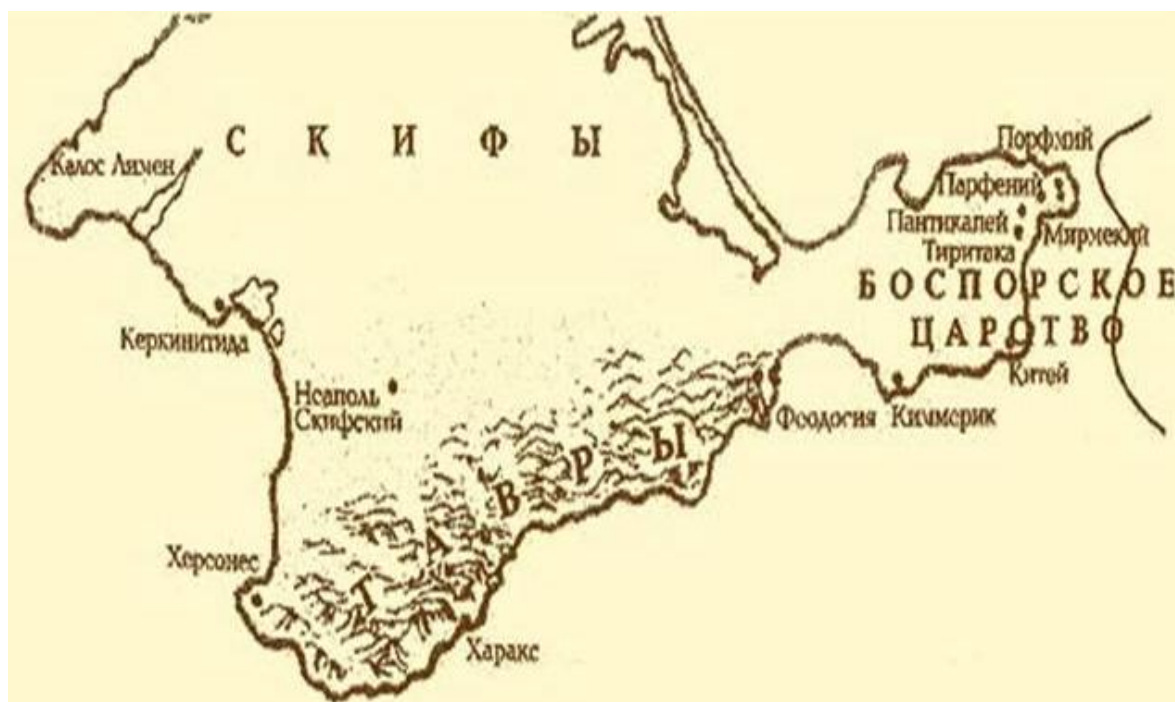
Рис. 1. Тавры, Скифы и Боспорское царство в Крыму

Наибольшего расцвета оно достигает во II веке до н. э. при царе Скилуре 15 . Столицей царства был город Неаполь (см. рис. 1), основанный, вероятно, Скилуrom, на берегу Салгира (около современного Симферополя) 16 .