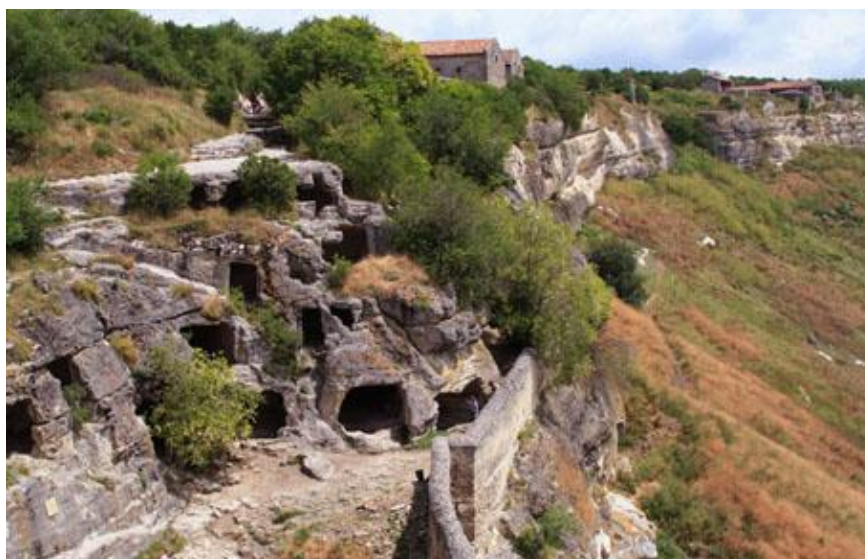
Рис. 2. Развалины Чуфут-Кале

Позже, когда на ханском престоле прочно утвердилась династия Гиреев, в долине Чурук-Су строится новая резиденция – Бахчисарай 65 . Крымское ханство – феодальное государство в Крыму – просуществовало с начала 1440-х по 1783 годы.