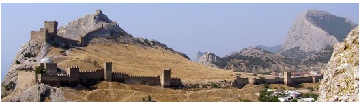
Рис. 5. Панорама «Генуэзской крепости»

Город Судак (с тюркского «су» – вода, «дак» – горный лес; у византийцев – Сидагиос и Сугдея, у итальянцев – Солдайя, в древнерусских источниках – Сурож, на крымско-тат. «Sudaq») основан Аланами (племена ирано-язычной группы) предположительно в 212 году. Ныне приморский город в средней части юго-восточного побережья Крымского полуострова с остатками т.н. «Генуэзской крепости» (см. рис. 5).