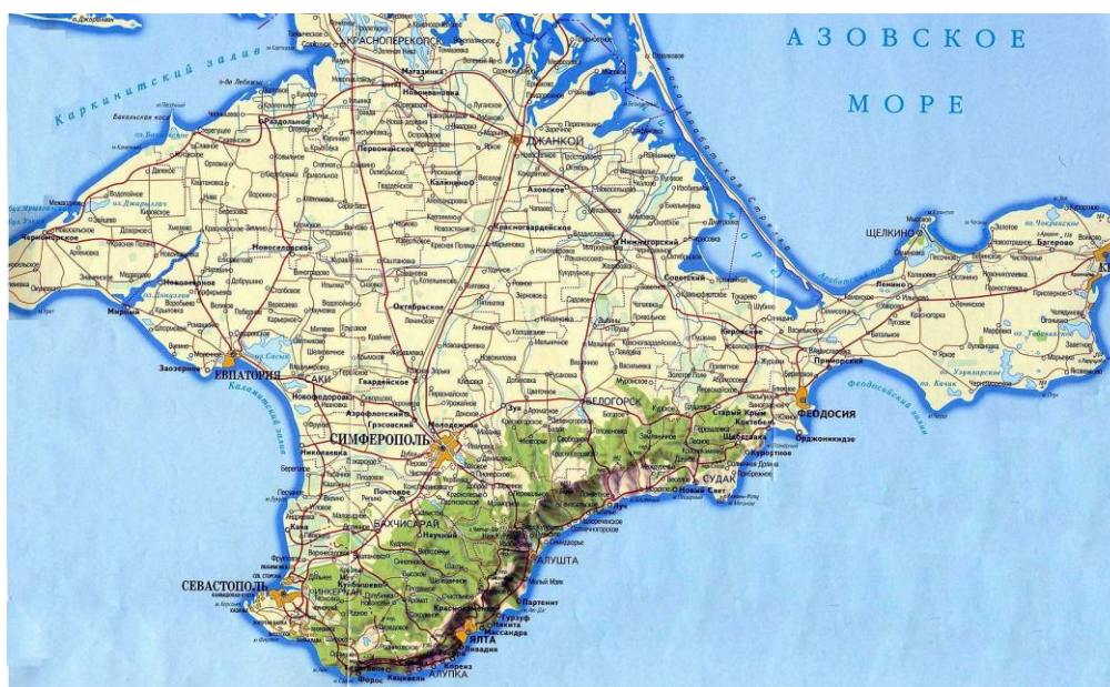
Рис. 11. Карта современного Крыма

На рис. 11 представлена карта современного Крыма.