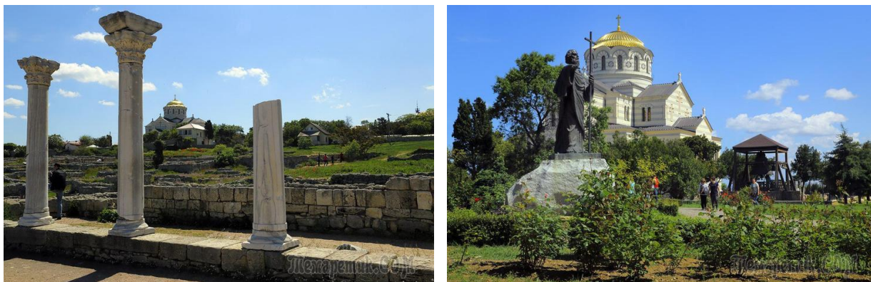
Рис. 3. Бывший Херсонес

Богородицы и которых невежды считают мраморными»)» 85 .