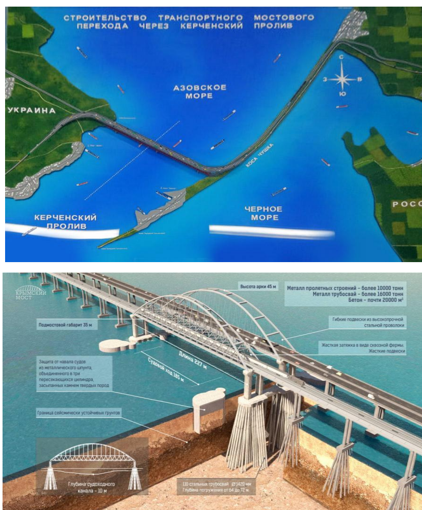
Рис. 12. Строительство моста через Керченский пролив

Эти вопросы постепенно решаются. В частности, одна из важнейших проблем – транспортная, непрерывная автомобильная и железнодорожная связь полуострова с материковой частью России – ныне реализуются путём строительства моста через Керченский пролив (рис. 12).