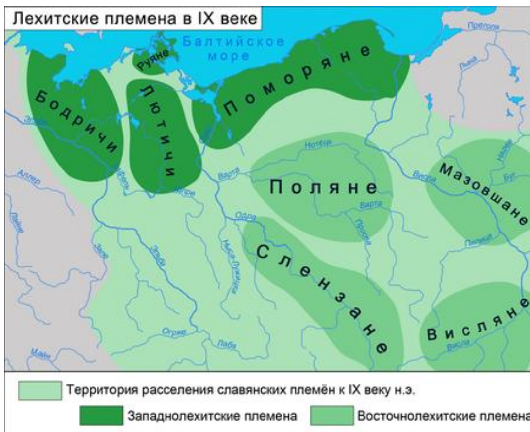
Рис. 2. Прибалтика в IX веке

Этимология слова « литы » – неизвестна, а звание «Князь Лютовский» не аналогично дефиниции «князь Литовский». Причём в первом случае термин вполне объясним, поскольку было племя лютичей и занимаемая ими территория (см. рис. 2). Герб же действительно перекочевал к литовцам и не только к ним, что может свидетельствовать лишь о связи знати первых со вторыми. Например, герб Рюриковичей стал гербом Украины... В этом случае по аналогии условно можно согласиться, что «истоки Литвы... в Поморье». Можно также предположить, что этнос « литва » (« литовцы ») возник из названия сословия, такие примеры в истории имеются.