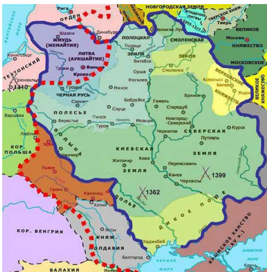
Рис. 3. Княжество Литовское в XIV веке

Великое княжество Литовское, Русское, Жемойтское и иных, сокращённо: Великое княжество Литовское – восточноевропейское государство, существовавшее с первой половины XIII века по 1795 год на территории современных Литвы, Белоруссии, Украины и России. Карта княжества Литовского в XII–XV века представлена на рис. 3.