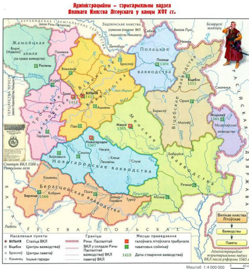
Рис. 4. Карта княжества Литовского в XVI веке

При этом некоторые авторы утверждают, что «Великое Княжество Литовское было славянской державой, где православие до определённого времени пользовалось равными правами с католичеством» 90 . В какой-то степени можно с этим согласиться, ибо, таким образом, подтверждается следующее: во-первых, что правящий класс всегда насаждает свой язык общения хотя бы на государственном уровне; во-вторых, что решающее значение в менталитете народа играет ведущееся в стране вероисповедание; наконец, в третьих, что до вхождения в Речь Посполитую народ Великого княжества Литовского был православным и в основном говорил на славянском языке. Таким образом, получается, что современные литовцы и белорусы в значительной степени один народ.