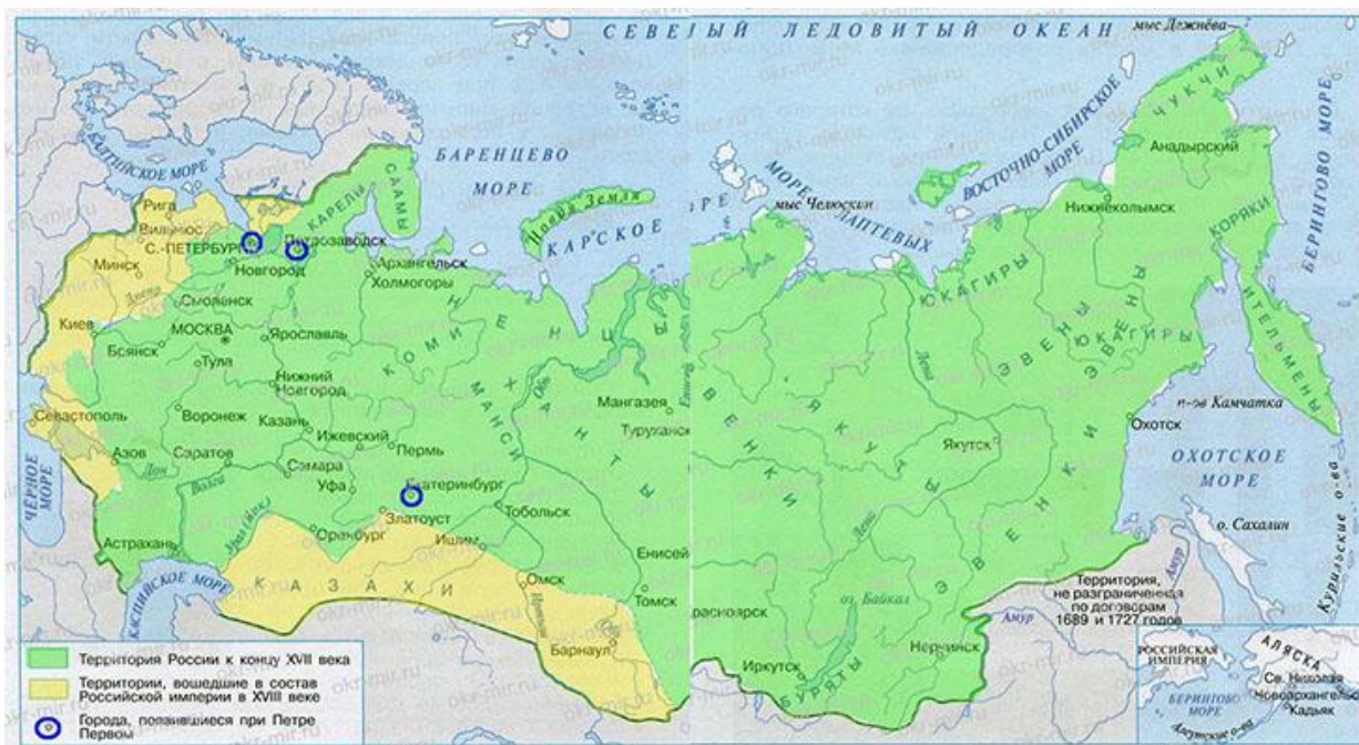
Рис. 5. Территория России в XVII–XVIII века

В 1772, 1793 и 1795 годы по итогам третьего раздела Речи Посполитой вся территория Польши и Великого княжества Литовского была поделена между Россией, Пруссией и Австрией, причём бóльшая часть территории Великого княжества Литовского (собственно княжество Литовское, герцогство Курляндское и Семигальское, рис. 5) присоединялась к России (вошли в состав Российской Империи) 95 . В XIX веке литовцы территорию Курляндии (западная часть Латвии) именовали «Latwija» 96 .