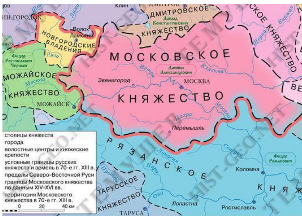
Рис. 3. Территория Московского княжества в XIII–XVI века

начале XVII века француз Жан Маржерет 41 , высказался следующим образом: «Русских стали называть москвитами по имени их главного города, а это так же бессмысленно, как называть французов парижанами» 42 .