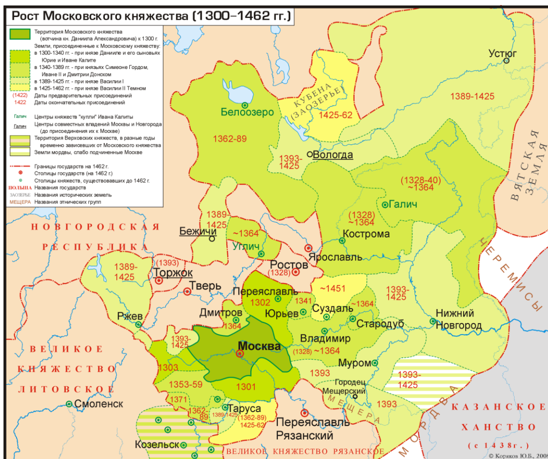
Рис. 2. Рост Московского княжества с 1300 по 1462 годы

Рост русского княжества с 1300 по 1462 годы представлен на рис. 2.