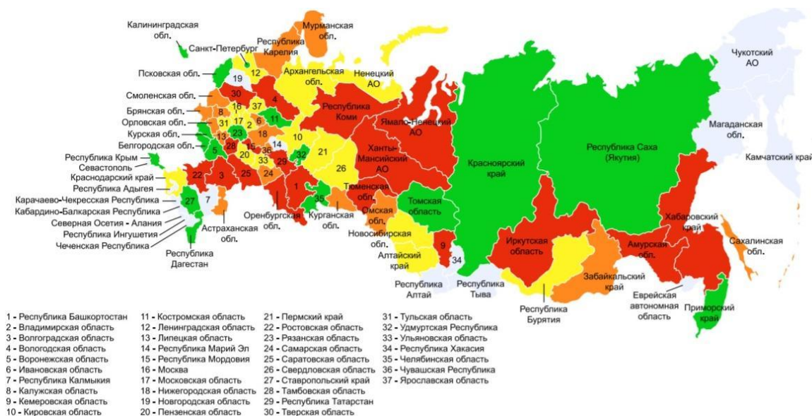
Рис. 3. Территориальное деление в РФ после 2015 г.

На рис. 3 представлены все республики, края и области Российской Федерации. Легко заметить, что в РФ чуть более 20 республик и не все они очевидны. Например, почему, да и зачем существуют одновременно Алтайский край и республика Алтай?