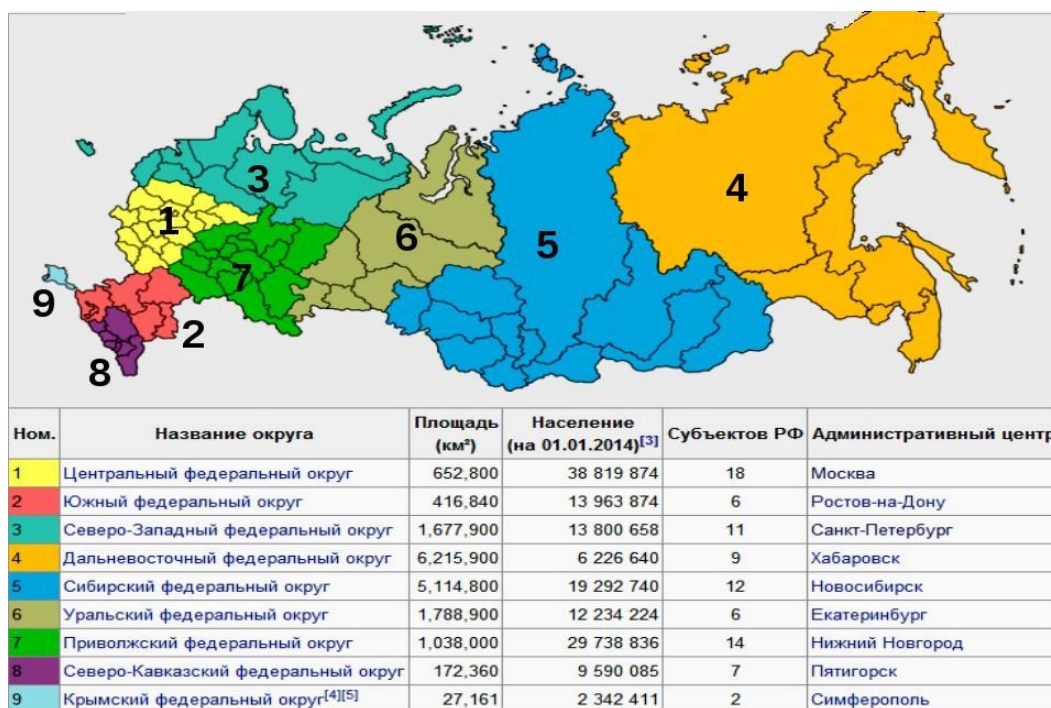
Рис. 2. Девять Федеральных округов РФ (с апреля 2014 г.)

Вернулась территория Крыма в Россию в 2014 году. 16 марта 2014 года на полуострове проводился референдум о статусе Крыма, на основании результатов которого и в соответствии с правом на самоопределение провозглашается независимая Республика Крым, подписавшая с Россией договор о вхождении в состав РФ. 17 марта 2014 года, после обращения Верховного Совета Автономной Республики Крым о принятия Республики в состав Российской Федерации в качестве нового субъекта Российской Федерации со статусом республики, Президент РФ Путин 122 подписал Указ о признании независимости Республики Крым. Договор вступил в силу 21 марта 2014 года, после его ратификации Федеральным Собранием. В тот же день Указом Президента РФ за №168 был образован Крымский федеральный округ (девятый в РФ). На рис. 2 изображено уже девять Федеральных округов.