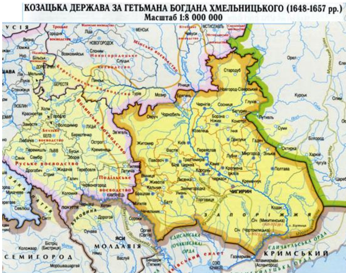
Рис. 7. Территория, принадлежавшая Запорожской сечи до 1654 года

занимала всего одиннадцатую часть современной Украины 58 , остальная территория принадлежала Новороссии 59 . Подтверждением служат, например, карта, представленная на рис. 6 или даже предложенная современными украинцами на рис. 7.