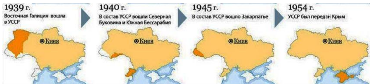
Рис. 5. Динамика формирования территории УССР с 1939 по 1954 годы

Общеизвестно, что территория, вошедшая в состав Российского царства при присоединении к ней Запорожской Сечи в 1654 году, затем многократно увеличилась вплоть до 1954 года (рис. 5 и 6).