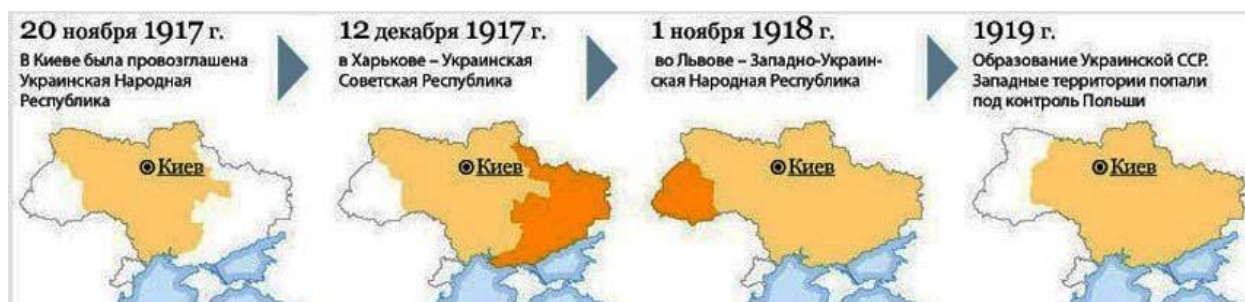
Рис. 4. Динамика формирования территории УССР с 1917 по 1919 годы

Республику (ЗУНР), а летом 1919 года – форсировали реку Збруч и вошли в Восточную Малороссию 40 . На рис. 4. представлена динамика формирования территории УССР с 1917 по 1919 годы.