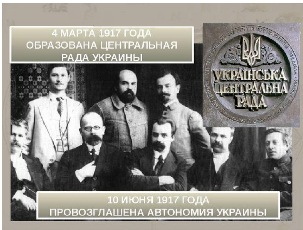
Рис. 1. Образование УЦР в 1917 г.

В 1917 году, сразу после Февральской революции, так называемые «передовые силы» выступили за самоопределение народов – то есть за отделение от России. В Киевской губернии... группа собравшихся в Киеве людей назвала себя Радой (рис. 1). 3 (16 – по новому стилю) марта 1917 года в Киеве это были представители различных политических, общественных, культурных и профессиональных организаций, которые на следующий день объявили о создании Украинской Центральной Рады (УЦР) – органа представительной власти, независимого от Временного правительства 9 .