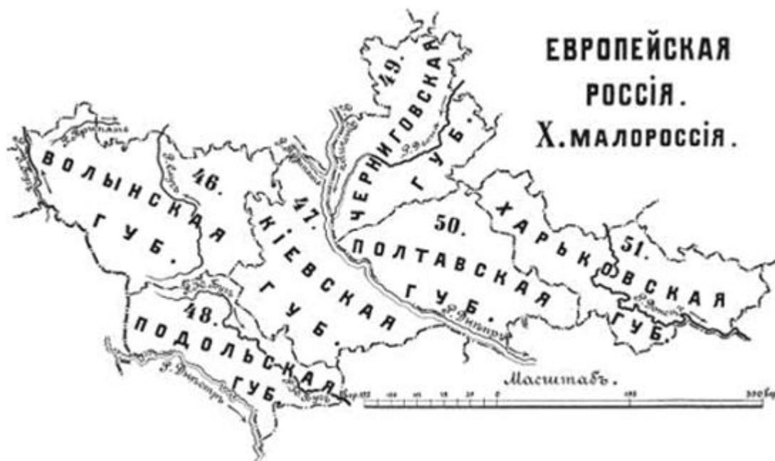
Рис. 2. Российские губернии, вошедшие в состав Малороссии

границами. Российская империя состояла из губерний...» 16 (рис. 2).