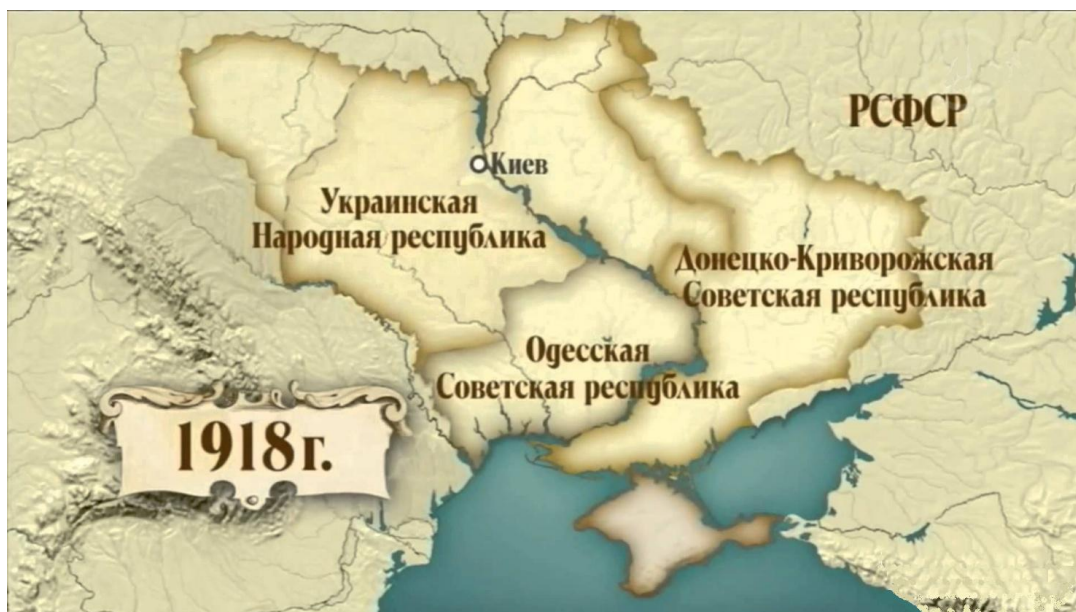
Рис. 3. Формирование республик в 1918 г. на территории будущей Украины

Отметим, что в 1917–1920 годы на территории современной Украины существовало несколько государств: Украинская народная республика, Западно-Украинская народная республика, Украинская держава, находившаяся в состоянии гражданской войны с Украинской советской социалистической республикой (УССР), возникшей в декабре 1917 года. Некоторые из них представлены на рис. 3.