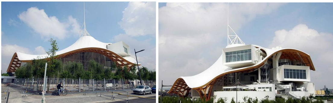
Рис. Центр Жоржа Помпиду в г. Метце

Крыша здания выполнена в китайско-японском стиле. Эклектика строения вызывает самые разные впечатления у прохожих и посетителей, воспринимающих его как гриб, фонарь и даже китайскую шляпу 2 .