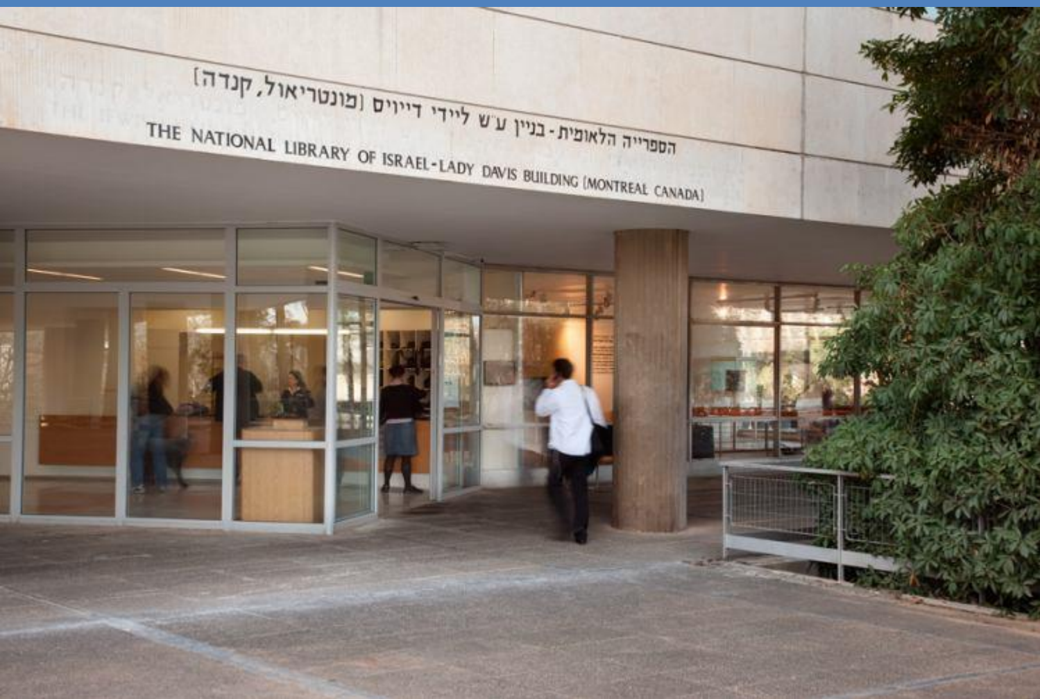
Национальная библиотека Израиля, г. Иерусалим