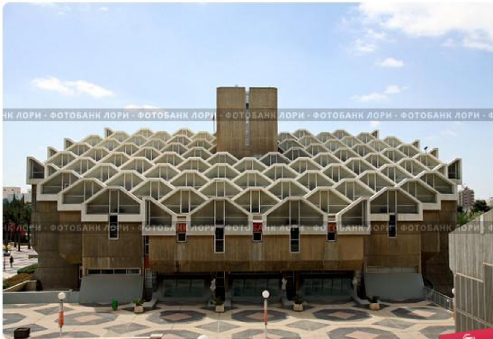
Библиотечный корпус Университета имени Бен Гуриона. Беэр Шева, Израиль