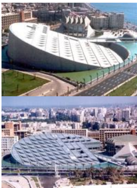
Рис. Здание новой Александрийской библиотеки

Новая Александрийская библиотека (Библиотека Александрина) построена в Египте на месте исчезнувшей старой. Новую 11-этажную библиотеку строили норвежские архитекторы. Авторский коллектив: «Snohetta». План ее возрождения был предложен в 1970 году, первый камень заложен в 1988 году, а завершилось строительство в 2002 году.