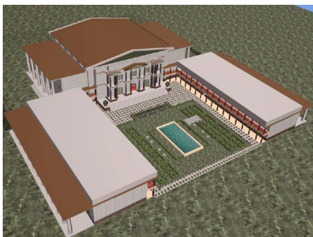
Рис. 2.9. Реконструкция здания Александрийской библиотеки

Эта библиотека предназначалась для нужд членов Мусейона и царской семьи и была открыта только для узкого круга пользователей. Более широкому кругу пользователей и ученых был доступен ее филиал, разместившийся в храме Сераписа, находившемся в другом городском квартале. Этой частью библиотеки могли пользоваться любые граждане города и приезжие. В результате Александрийская библиотека стала самым крупным культурным и научным центром античного мира, первой публичной библиотекой. Более того, в ней был создан первый в истории письменный каталог книг – «Таблицы», автором которого был главный хранитель Каллимах.