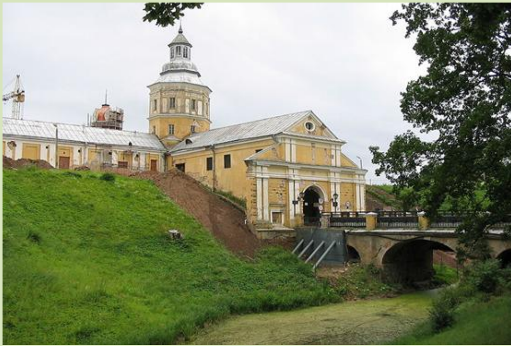
Замок Радзивиллов, г. Несвиж