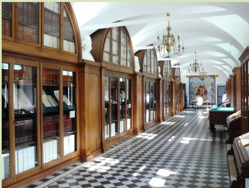
Интерьер библиотеки Радзивиллов. г. Несвиж

Основал библиотеку Несвижского Замка Николай Радзивилл Черный (1515-1565 гг.).