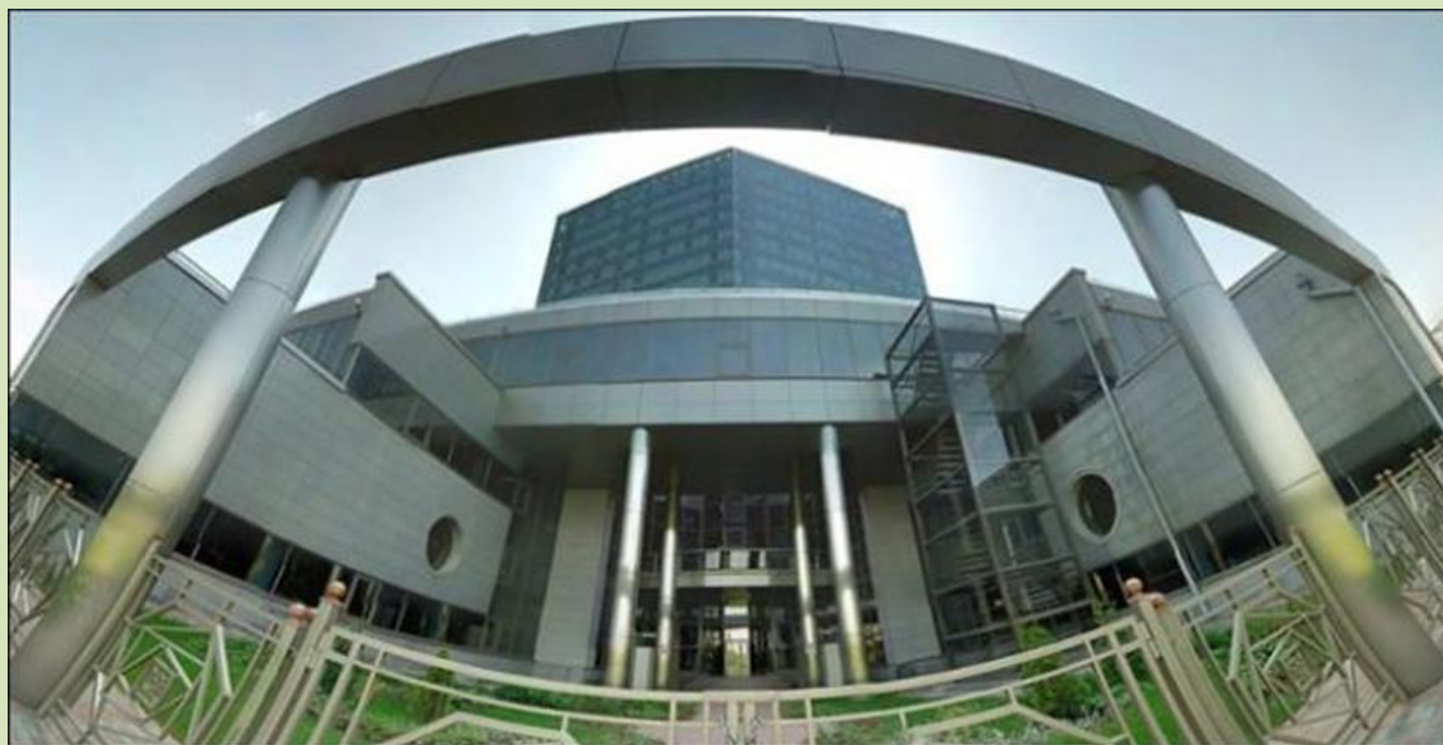
Новое здание Национальной библиотеки Беларуси