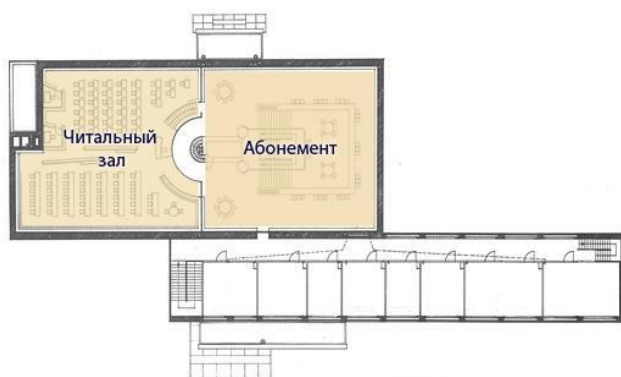
Рис. План второго этажа

галерейной библиотеки, ... в которой весь фонд расположен как вдоль стен помещений библиотеки, так и на лестничных переходах» .