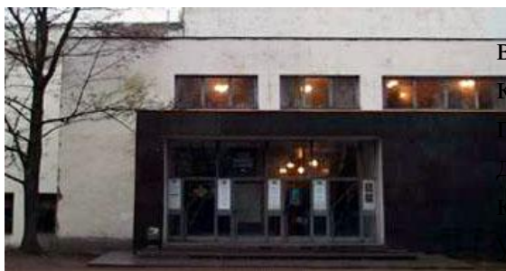
Рис. Вход в здание городской библиотеки г. Выборга

Центральная городская библиотека в Выборге (архитектор Алвара Аалто), которую одни специалисты относят к памятникам регионального модернизма, а другие – функционального стиля, в котором все подчиняется идее создания удобства пользователям. Вход в здание, строившегося с 1927 по 1935 годы, изображен на рисунке.