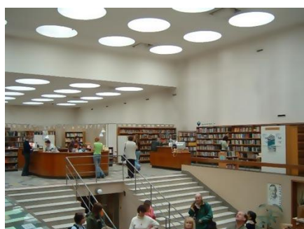
Рис. Внутренний интерьер от входа в городскую библиотеку г. Выборга

Вернемся к Выборгской библиотеке и более подробно рассмотрим ее архитектурно-планировочные решения.