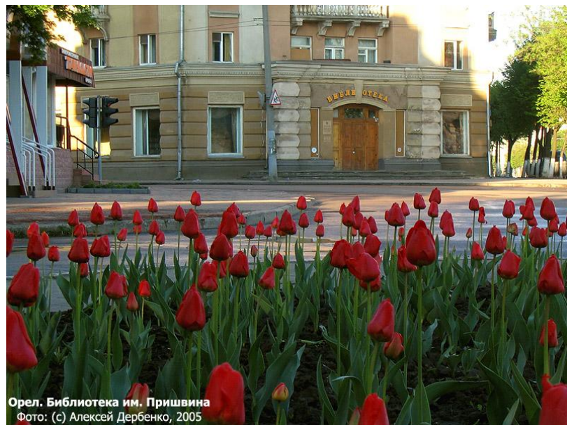
Орел. Библиотека им. Пришвина