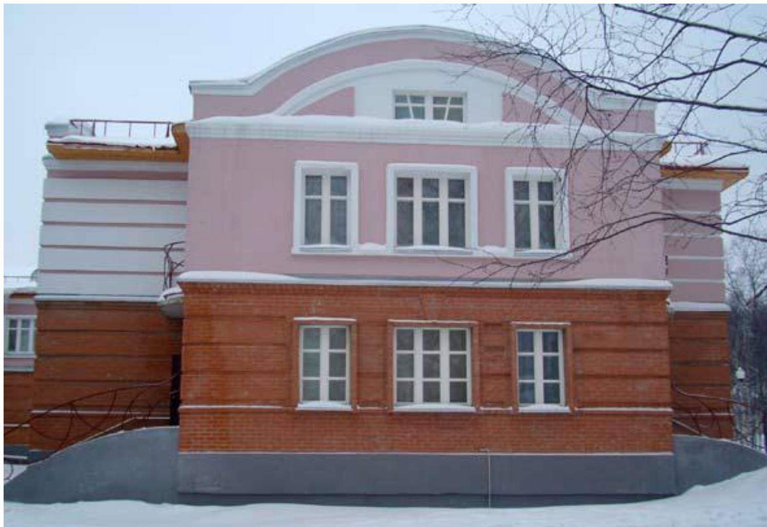
Вожегодская районная библиотека