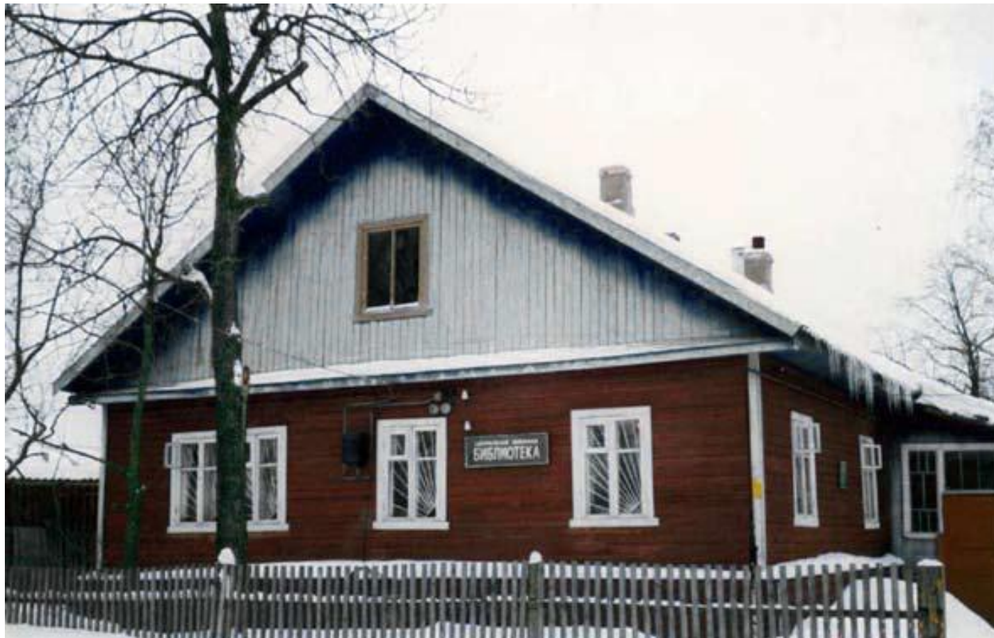
Бабаевская центральная межпоселенческая библиотека