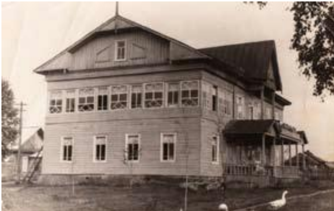
Бабушкинская районная библиотека