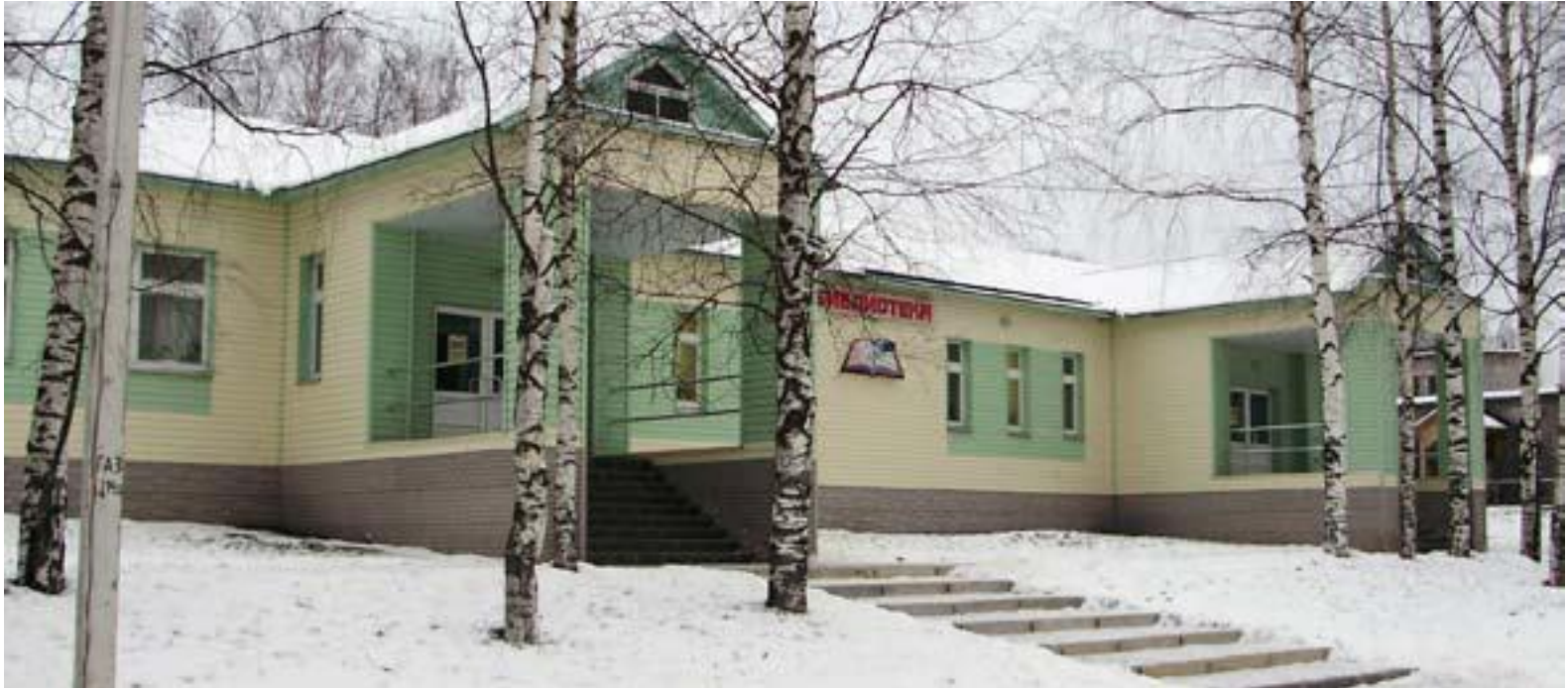
Библиотека Тарногского Городка